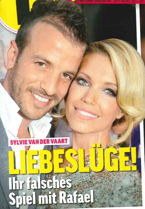
SYLVIE VAN DER VAART